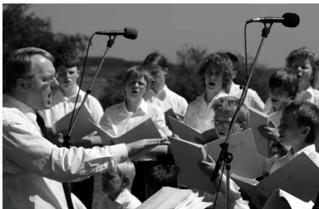
Thisted kirkes drenge-mandskor har medvirket ved gudstjenester talrige steder - bl.a. var koret helt selvfølgeligt med ved provstiets første fælles friluftsgudstjeneste i 2006.

om, og fra 1. oktober 1988 kunne jeg optage 10 herrestemmer i koret, som efter engelsk forbillede fordelte sig på kontratenorer (mandlige falsetsangere der synger alt stemmen), tenorer og basser.