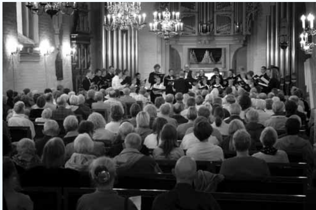
Gennem sine foreløbig 25 år har Thisted kirkes drenge-mandskor givet en lang række koncerter - her i Thisted kirke.

Menighedsrådet vedtog at søge et drengekor oprettet og afsatte midler på budgettet for 1982. Koret medvirkede første gang i kirken søndag den 18. april 1982 og kan således i år